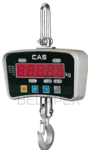
Весы Caston-I (ТНА) (MAX=0.5 т)