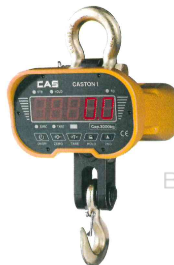
Весы Caston-I (ТНА) (MAX=1, 2, 3, 5 т)