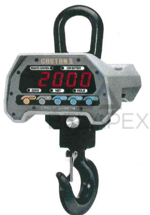
Весы Caston-II (ТНВ)