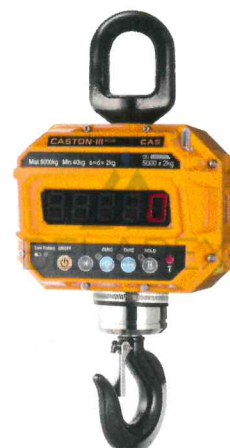
Весы Caston-III (ТНД)